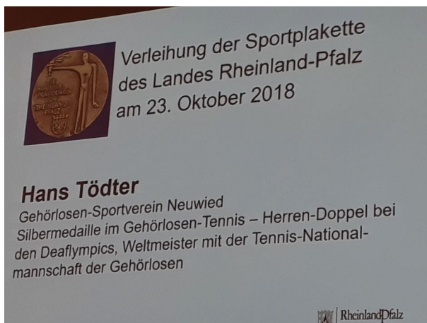
Hans Tödter wurde aufgerufen

Im Rahmen der Verleihung wurden bei vielen erfolgreichen Sportlerinnen und Sportler visuell Bilder und Filmausschnitte gezeigt, damit sich die Gäste ein Bild von deren Erfolgen machen können.