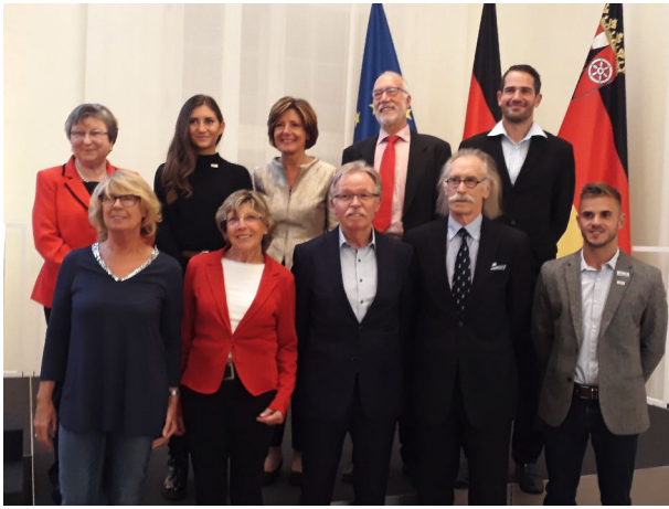
Gruppenbild der geehrten Personen